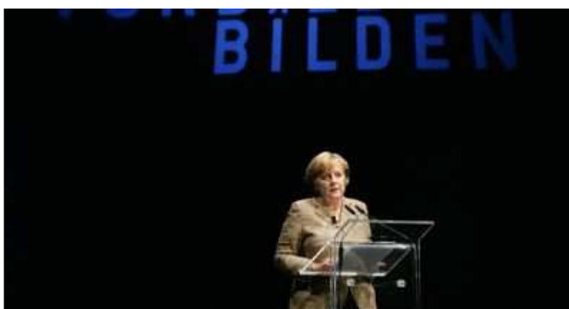
La chancelière fédérale Angela Merkel présidant une remise de prix à la Fondation Bertelsmann (2007).

La création d'un grand marché transatlantique pour 2015 est la grande ambition des dirigeants européens et états-uniens. Après la visite du Président Obama en Europe, lors du sommet UE/États-Unis, le Parlement européen en a profité pour adopter une résolution le 26 mars 2009 appelant à réussir ce marché transatlantique. Il est même appelé à un « renforcement de la coordination entre les institutions monétaires européennes et américaines » [1]. En fait, ces affirmations ne sont que la suite logique des travaux en amont de la Fondation Bertelsmann . L'ambition est d'aboutir à un seul marché unique transatlantique dont les conséquences concerneront les Français et tous les peuples d'Europe.